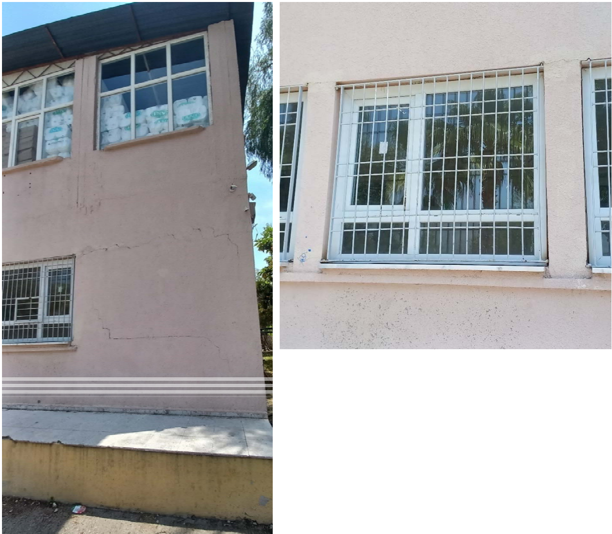
Fig. 13: Danni lievi all'interfaccia delle tamponature