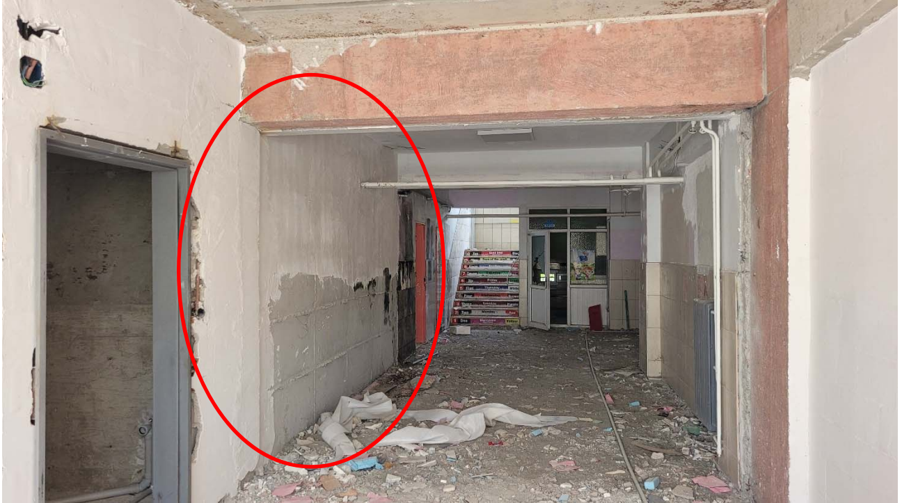
Fig. 14: Inserimento di setto in c.a.

Intervento di rinforzo non completato prima del sisma.