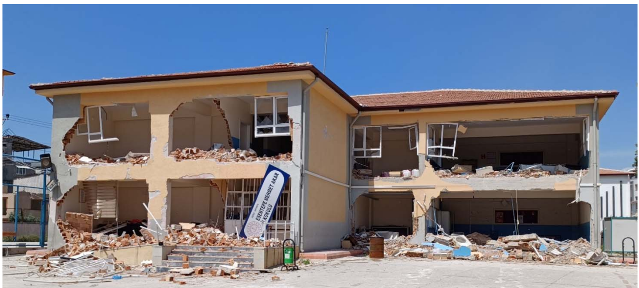
Fig. 11. Ribaltamento fuori piano di tamponature e tramezzi di entrambi i piani.