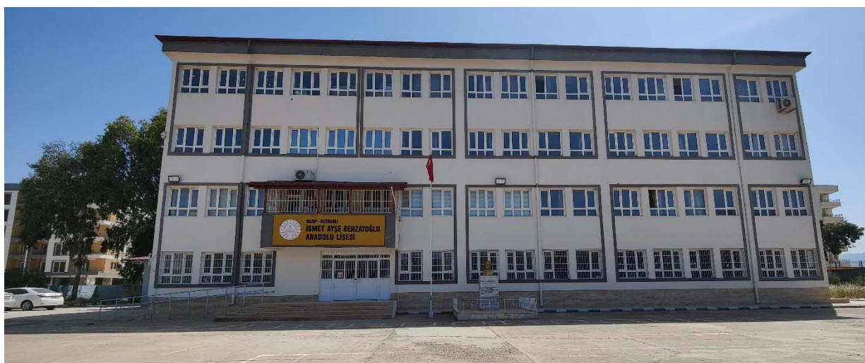
Fig. 2. -. Vista frontale dell'edificio.

L'edificio è stato classificato come moderatamente danneggiato e chiuso temporaneamente alle attività didattiche a causa di fessure di tipo flessionale su due travi dei telai longitudinali, una delle quali riportata in Fig. 3 e di ampiezza pari a 0.5 millimetri. L'edificio presenta un sistema di rinforzo costituito da setti in cemento armato disposti nella zona centrale della pianta e su tutta l'altezza.