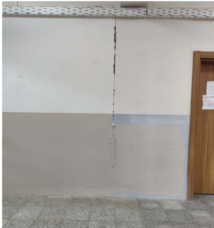
Fig. 5 – Distacco della tamponatura.