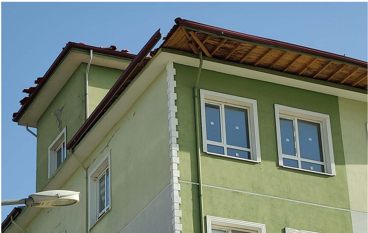
Fig. 7 – Collasso di parte della copertura.

Edificio chiuso alle attività didattiche. L’edificio presenta lesioni diffusi su tutti i prospetti che sembrano interessare il solo intonaco. E’ presente un evidente danno alla copertura: una porzione della falda sul prospetto principale risulta traslata e parte del rivestimento della copertura è dislocata.