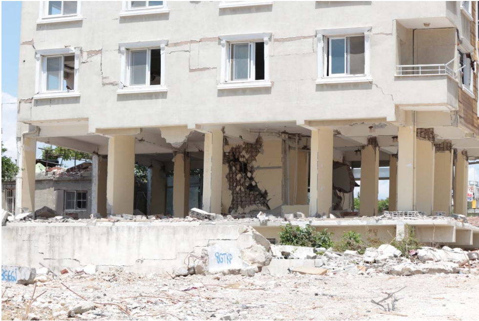
Fig. 16. Danneggiamento setto in c.a. a taglio e danno in testa ai pilastri al piano terra.

Alcuni danni osservati nella città di Antiochia: