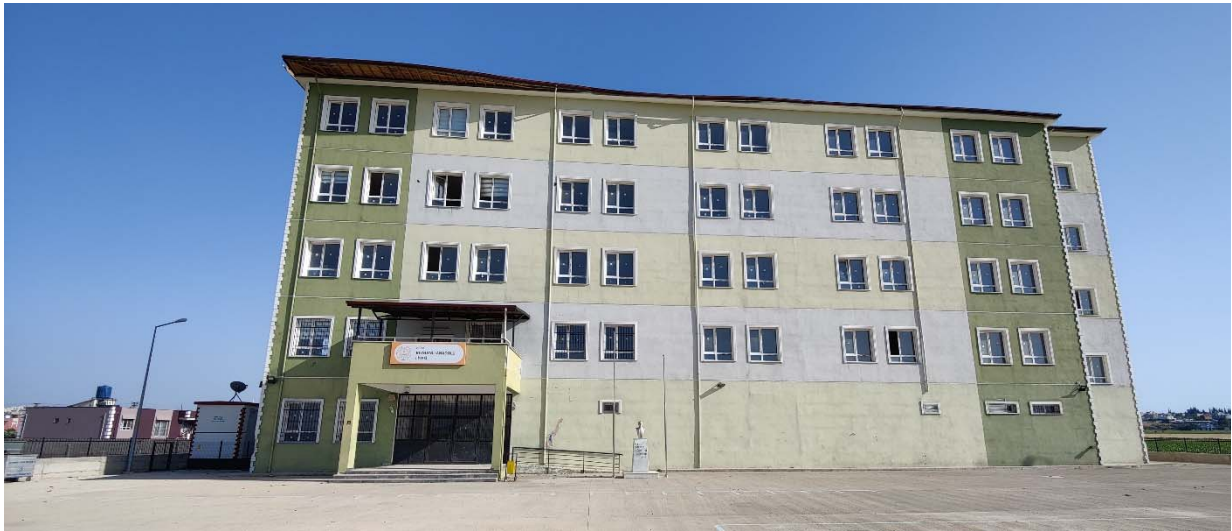
Fig. 6 – Vista frontale dell’edificio.