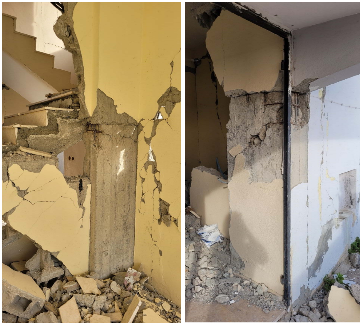
Fig. 15: Danno ai pilastri

Nella città di Erzin è stato osservato un danno ai pilastri in corrispondenza delle scale del balcone esterno in c.a.