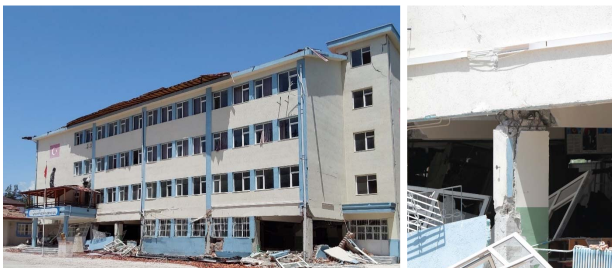
Fig. 9. Effetto di piano soffice connesso anche al ribaltamento parziale delle tamponature di facciata; plasticizzazione flessionale dei pilastri .