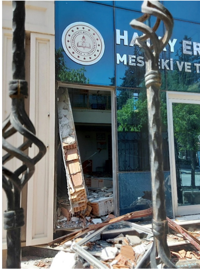
Fig. 12. Ribaltamento tramezzature all'interno dell'edificio