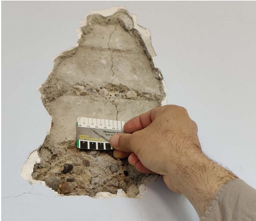
Fig. 3. -Posizione della fessura flessionale sulla trave.