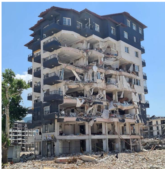
Fig. 18 Collasso delle tamponature esterne e danno alle travi perimetrali in un edificio a telaio con pilastri arretrati.

Nella città di Atakoy si è osservata, tra l'altro, una crisi a taglio in più pilastri in c.a. adiacenti alla cassa scala