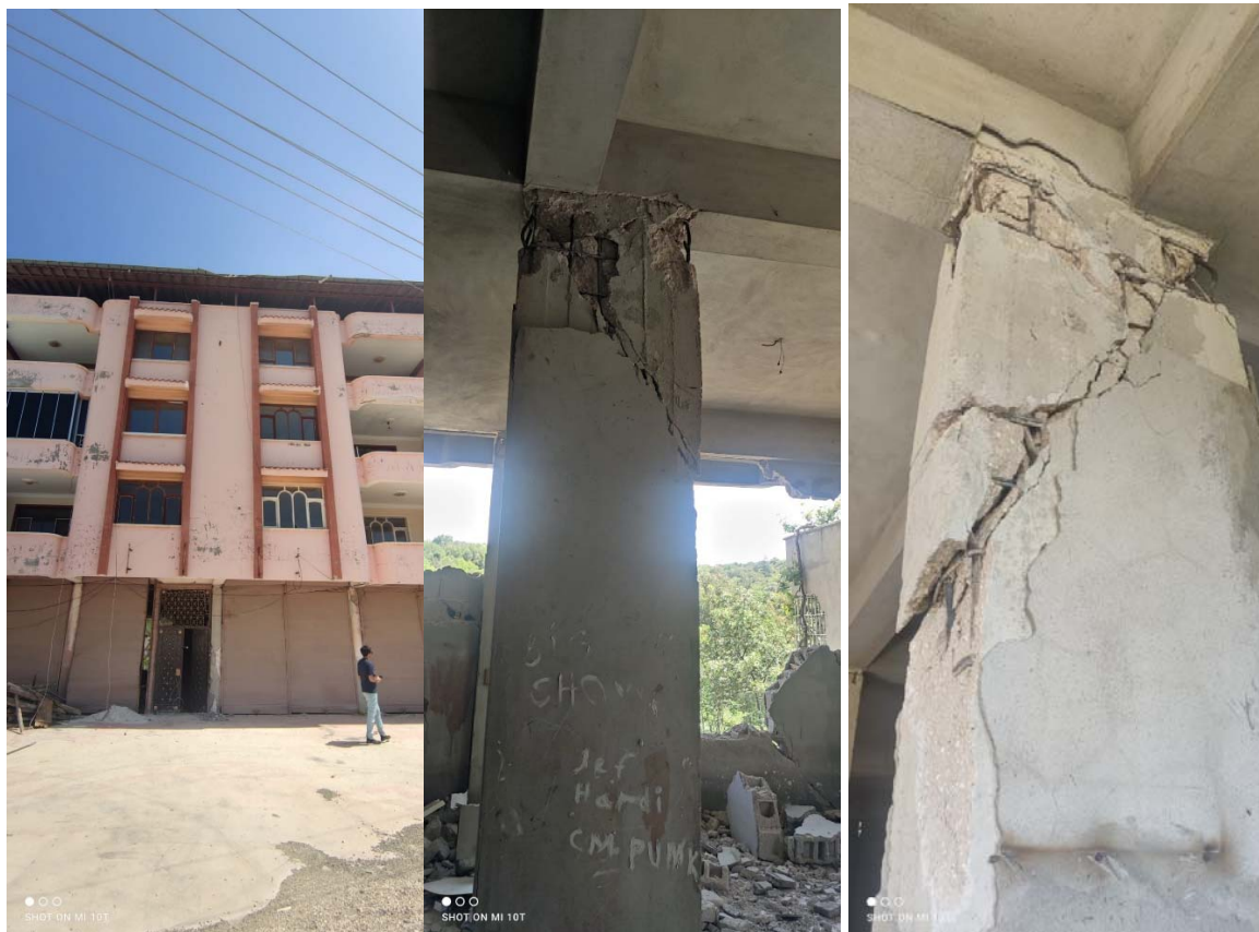
Fig. 19 Crisi a taglio in più pilastri in c.a. di edifici adiacenti alla cassa scala

Nella città di Atakoy si è osservata, tra l'altro, una crisi a taglio in più pilastri in c.a. adiacenti alla cassa scala