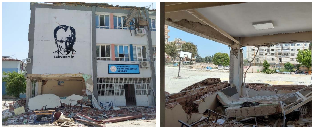
Fig. 8 Pannello di sinistra: vista frontale; pannello di destra: vista dall'interno, muri esterni ribaltati e plasticizzazione pilastri con disorganizzazione del nucleo del calcestruzzo per mancanza di adeguato confinamento passivo