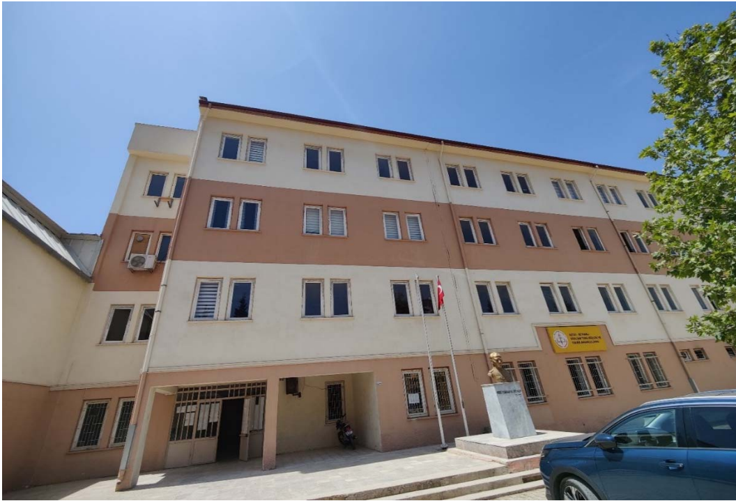
Fig. 4 Vista frontale dell'edificio