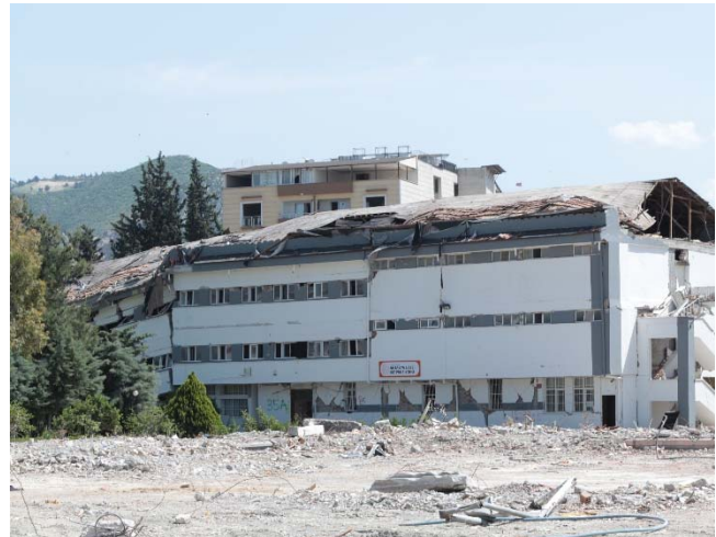
Fig. 17. Collasso edificio per danni a livello dei pilastri del piano terra di un intero blocco.